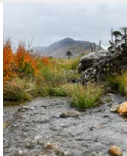
Parque Nacional Tolhuaca, Chile

Criando resiliência às mudanças climáticas