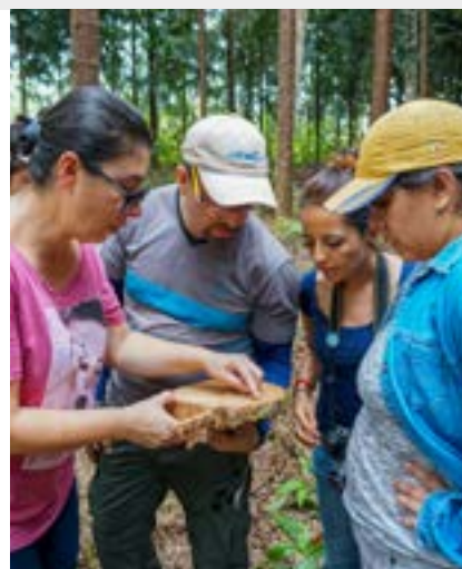
Treinamento em árvores restauradas recentemente colhidas após 15 anos de crescimento, a Costa Rica © Sabin Ray, Instituto de Recursos Mundiais

São aspectos fundamentais para a sustentabilidade dos esforços de restauração na região.