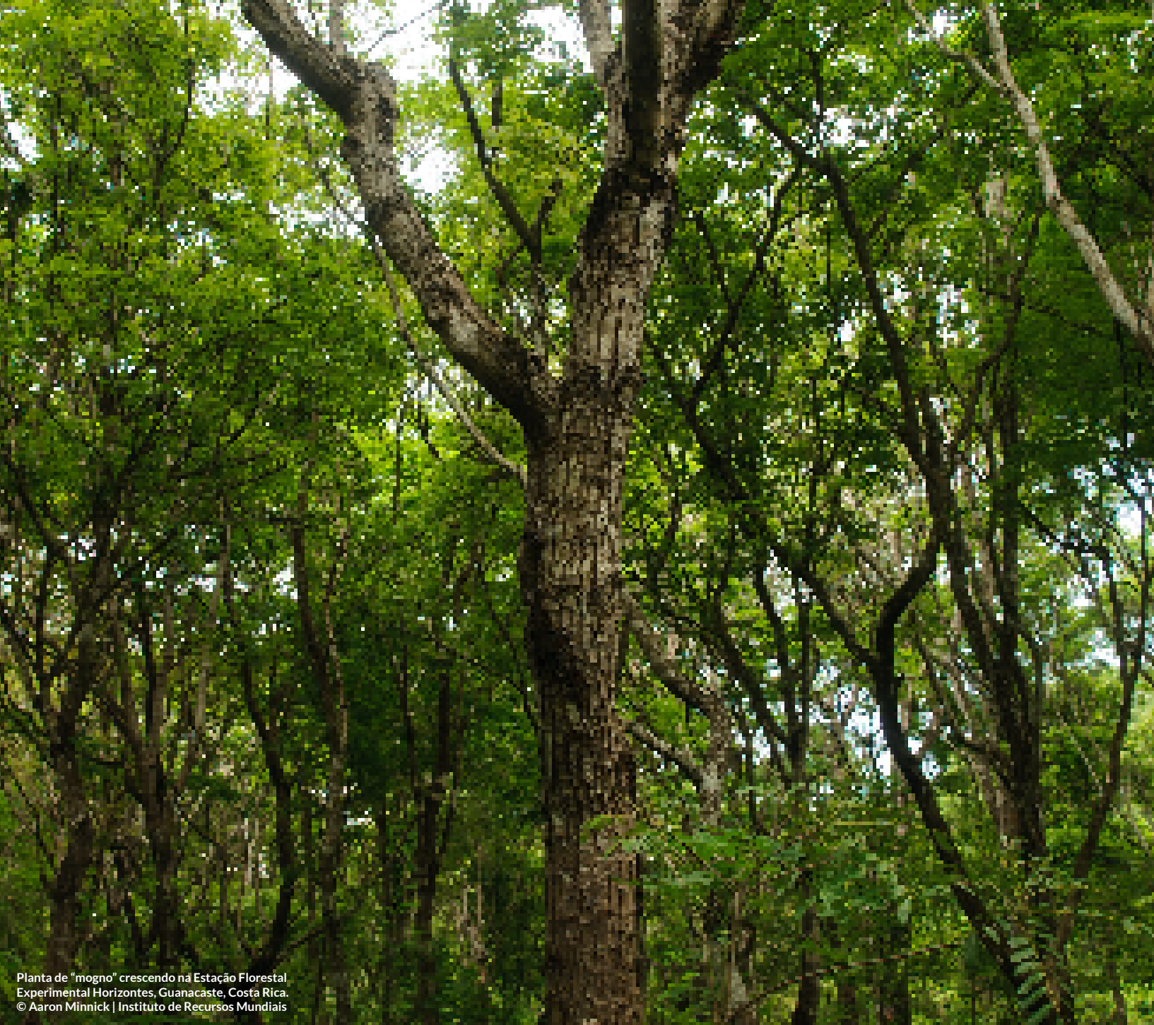
Planta de "mogno" crescendo na Estação Florestal Experimental Horizontes, Guanacaste, Costa Rica.