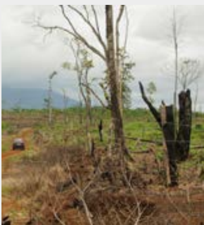
Floresta desmatada, Costa Rica