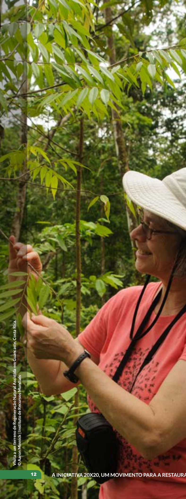
Visita a um terreno de Regeneração Natural Assistida em Guanacaste, Costa Rica.