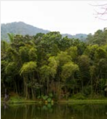
Visita de campo ao Parque Natural Nacional Farallones de Cali, Colômbia © James Anderson, Instituto de Recursos Mundiais.

A América Latina e o Caribe (ALC) abrigam 23% das florestas do mundo, cobrindo aproximadamente 47% da região.