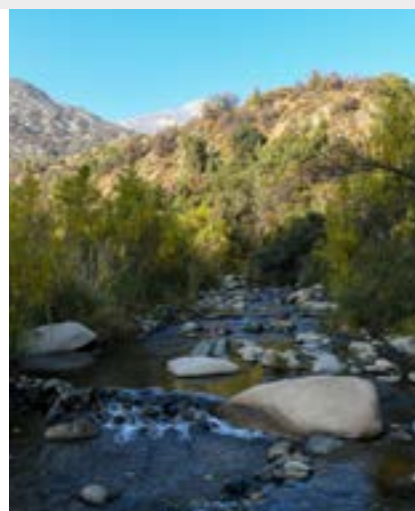
Reserva Rio Carrillo, Chile

Adaptação a eventos climáticos extremos, como inundações e incêndios