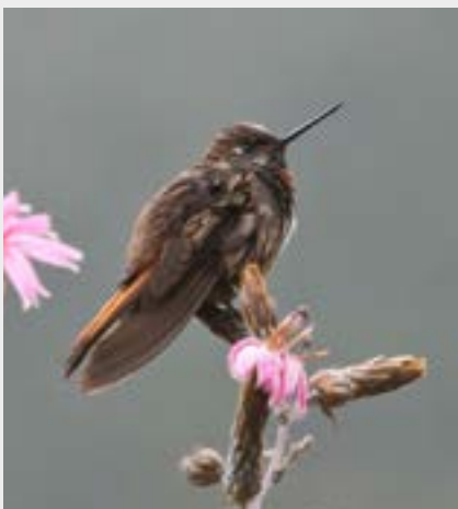
Aves de Apurímac, Peru © Nicolas Villalume para o Programa Florestas Andinas.

Estes são essenciais para a biodiversidade e os serviços ecossistêmicos.